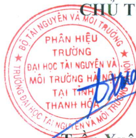
Trần Xuân Biên